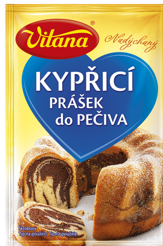
Kypriaci prášok do pečiva